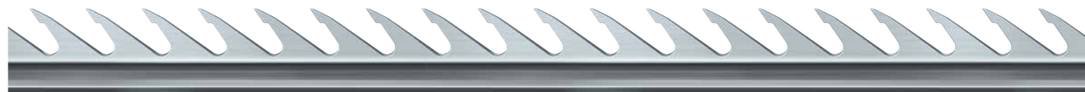
具有超光洁表面的SiroLock™